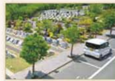
墓域近くに駐車スペース

◎ペットと一緒に入れる区画もあります。 ※掲載のイラストは、立地条件を概念化したものであり、建物の形状・位置・距離関係・周辺建物との縮尺等は実際と異なります。